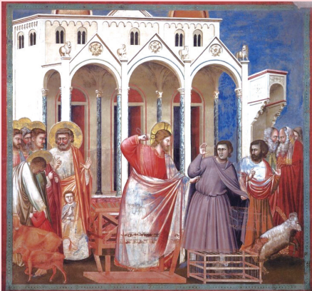
<성전에서 환전꾼들을 쫓아내시는 그리스도>